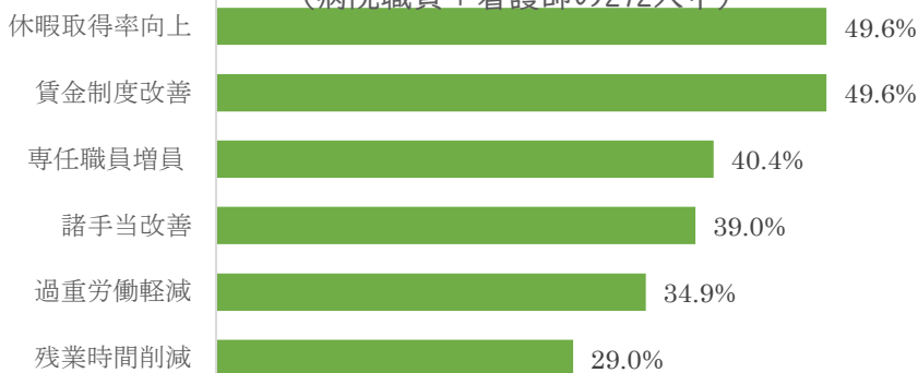
取り上げてほしい課題上位5項目 (病院職員+看護師の272人中)

「2022年春闘でぜひ取り上げてほしい課題」についての設問に対し、「賃金制度の改善」と休暇取得率の改善が同率一位での高率回答でした。回答の内容を見て、病院では年々休暇に関する状況がひどくなっていると感じています。有給休暇の年5日取得が義務化されましたがこれは最低基準です。今春闘でも休暇取得の問題、人員不足について交渉していきます。